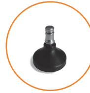
Patin noir en polypropylène.