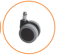
Roulette soft noir en nylon et caoutchouc antistatique.