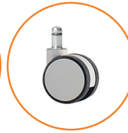
Roulette blanc en nylon.