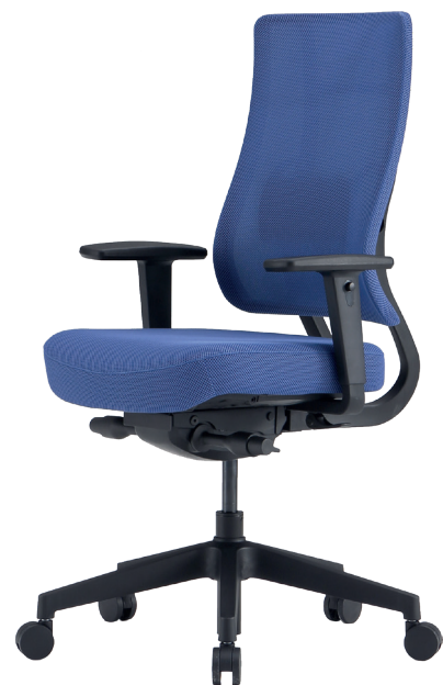
Version coloris noir