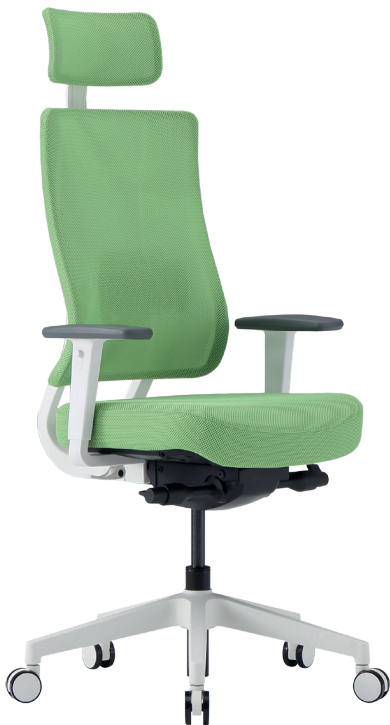
Version coloris blanc