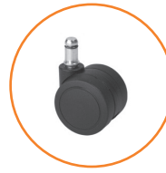
Roulette noir en nylon.